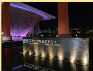
静岡県富士山世界遺産センター