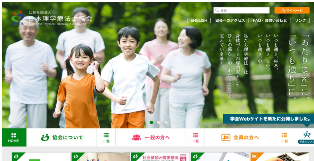
日本理学療法士協会 HP よ