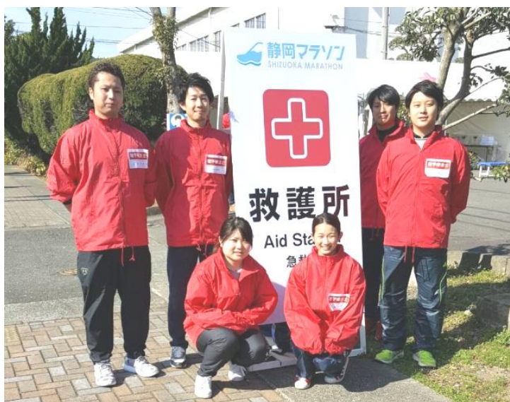
【写真は新緑町救護所のスタッフ】

最後に静岡マラソン 2017 のサポート活動にあたり、多大なご支援を頂きました関係者の皆様に深く御礼申し上げます。