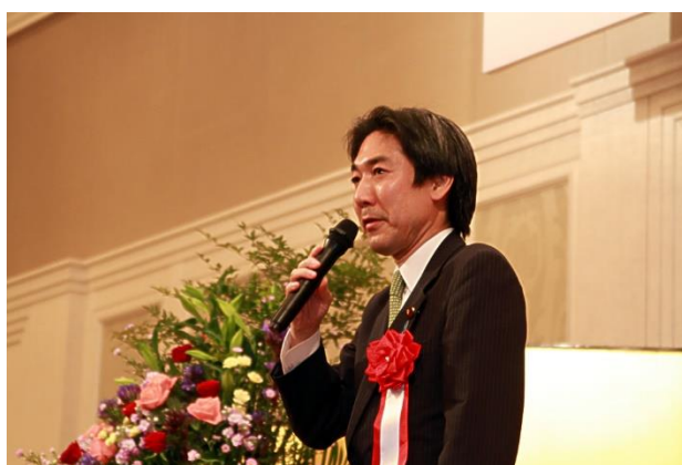
【衆議院議員 城内実様】