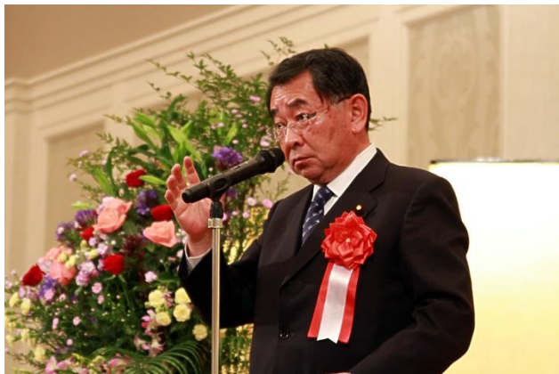
【衆議院議員 塩谷立様】