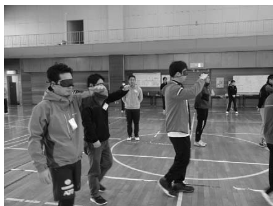
【視覚障がいの体験】