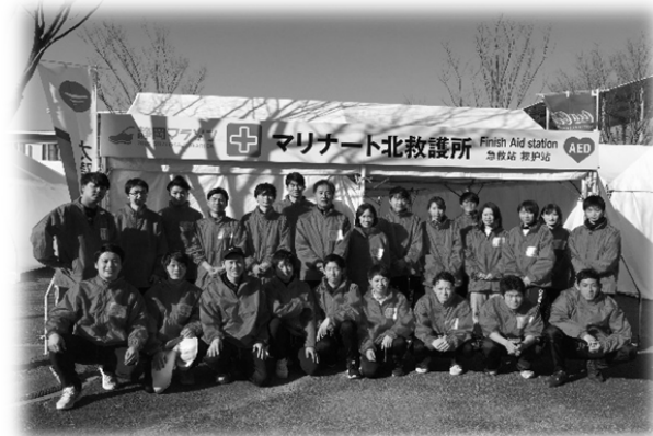
【フィニッシュ地点救護所のスタッフ】