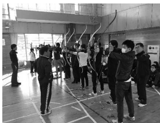
【アーチェリーの実習風景】