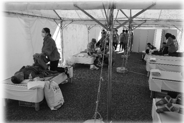
【救護所での活動の様子】

最後に静岡マラソン 2018 の救護活動にあたり、多大なご支援を頂きました関係者の皆様に深く御礼申し上げます。