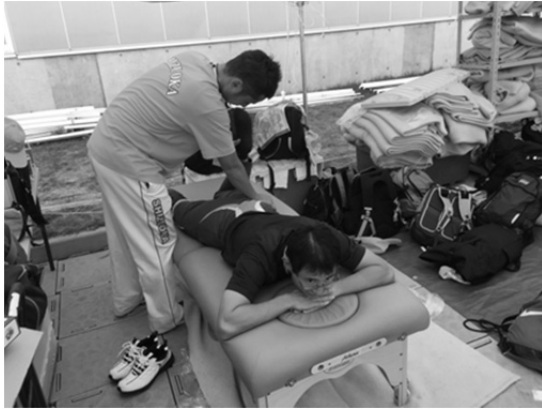
トレーナーブースでの様子

浜松市帯同 1 名)でした。我々は事前に数回の強化練習から参加し、練習中に訴えのあった選手のサポートを行いました。強化練習は炎天下の中で行われたため、熱中症を予防するために水分補給を促すような声掛けも行いました。10月6日には結団式が多くの来賓の方がお見えになるなか盛大に行われ、このような大きな大会に帯同できる喜びを感じ、期待に胸を膨らませ大会本番へと向かいました。