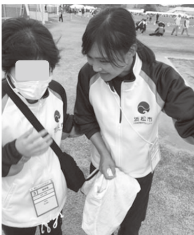
視覚障がいの者の介助の様子