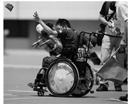
ビーンバック投げ

大会帯同中は選手の待機場所に設けた救護所と宿舎にて競技前後のケア、コンディショニング、救急時の対応などを行い、また、視覚障がい者や車椅子利用者の競技会場での移動や宿舎での生活面の援助を行いました。主な活動内容としては救護所と宿舎にて選手の症状に対するストレッチングやテーピング処置を中心に行いました。各団体の総処置件数は 82 件であり、大会 2 日目に実施した処置が 32 件とコンディショニングのためのストレッチや競技直前のテーピング処置が多くを占める結果となりました。不慣れな長距離の移動や、環境の変化などから、身体の違和感を訴える選手が多くいた印象を受けました。また、普段接することの少ない知的障がいのある選手たちの訴えを明確化することに難渋しました。帯同中に選手とコミュニケーションとり、その選手の性格を理解してケアに活かす必要性を感じました。宿舎ではトイレへの移動や館内・大浴場での歩行支援を行い、視覚障がいの方の歩行支援はタイミングよく声をかける努力をし、徐々に選手とコミュニケーションがとれるようになりました。