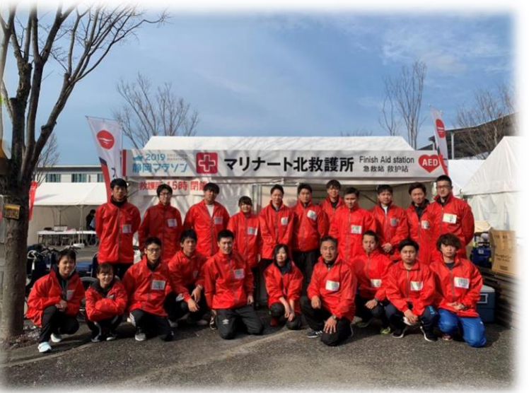
フィニッシュ地点救護所のスタッフ