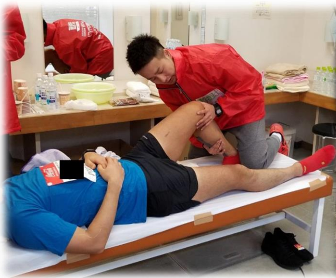
救護所内での活動

最期に静岡マラソン 2019 の救護活動にあたり、多大なご支援を頂きました関係者の皆様に深くお礼申し上げます。