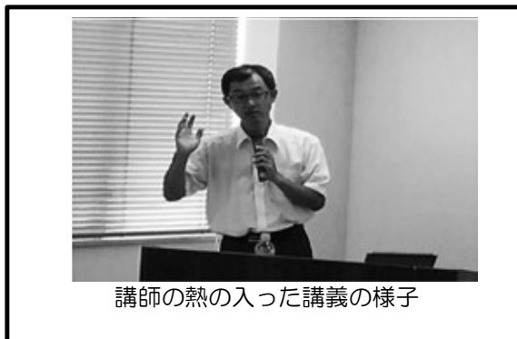
講師の熱の入った講義の様子

②で紹介した講座の講師を行うための「企画」から「運営のノウハウ」を学び、講座が担当できる人材育成を目的にした研修会を開催しています。