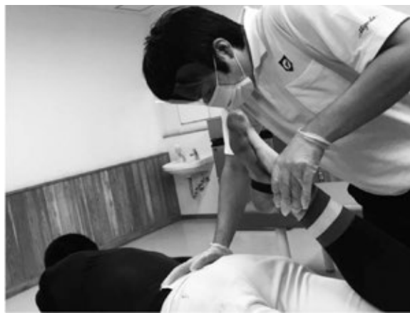
【選手への介入風景】

※ 室内では換気を徹底し、マスク、フェイスシールド、ディスポグローブを装着しての介入を実施