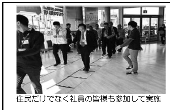
住民だけでなく社員の皆様も参加して実施