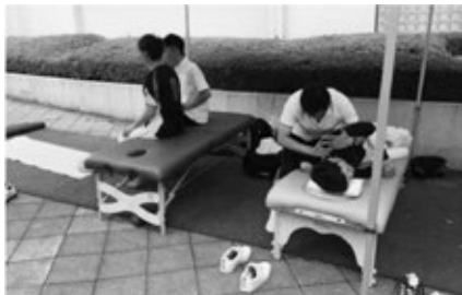
【障がい者スポーツにおけるMS活動】