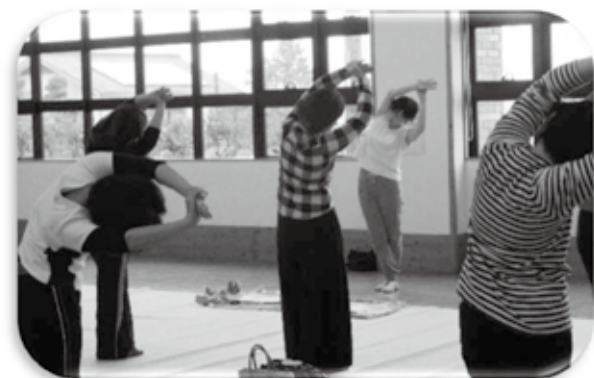
2019年 伊豆の国市葦山福祉・保健センターにて

教室の内容は骨盤モデルを用いて骨盤底筋群についてイメージを持っていただきます。そして、姿勢と骨盤底筋群、インナーユニットと呼吸、ストレッチ、会陰腱中心を触診し骨盤底筋群の収縮を衣服の上からを確認し骨盤底筋群エクササイズ、骨盤安定化エクササイズ、抱っここの仕方・抱き上げ方・抱っこ紐の使用方法等のADL指導をおこなっています。可能な限り託児を設置した上、健康増進部で作成した教室共通の資料を用い60分から90分の教室を開催しています。講師と運営スタッフ3名と見学スタッフで教室を開催しています。