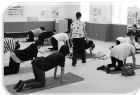
2019年9月 富士宮市保健センターにて

参加者のママのアンケートからも「産後にはとても必要な教室です」「骨盤ケアをしたかったけど何をどうやればいいのかわからなかったので教えてもらって家でもやろうと思いました」「エクササイズが分かりやすかった。実際にPTの方に筋肉など触って頂きながら指導を受けられて良かった」等、高評です。