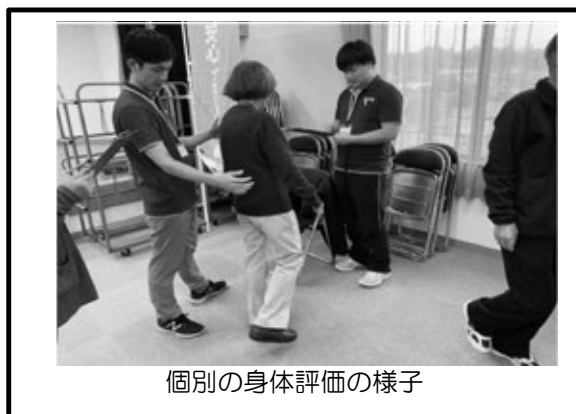
個別の身体評価の様子

ダイハツ工業の依頼を受けて、地域住民に対して個別の身体評価、運転に必要な身体機能、認知機能について指導を行います。