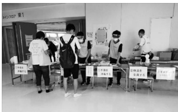
【会場での受付の様子】