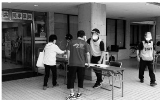
【受付での検温の様子】

令和 2 年 9 月 19 日（土）と 20 日（日）の 2 日間、草薙総合運動場陸上競技場で第 21 回静岡県障害者スポーツ大会「わかふじスポーツ大会」のフライングディスク競技が開催されました。本大会は、障害者スポーツの振興を図るとともに、障害のある人に対する社会の理解と認識を深め、障害のある人の自立と社会参加の促進に寄与することを目的とした大会となっております。今回の新型コロナウイルス感染症（COVID-19）の影響により、残念ながら中止となった競技種目もありますが、今回のフライングディスク競技を含めた 7 競技が全 10 日間の日程で開催されます。